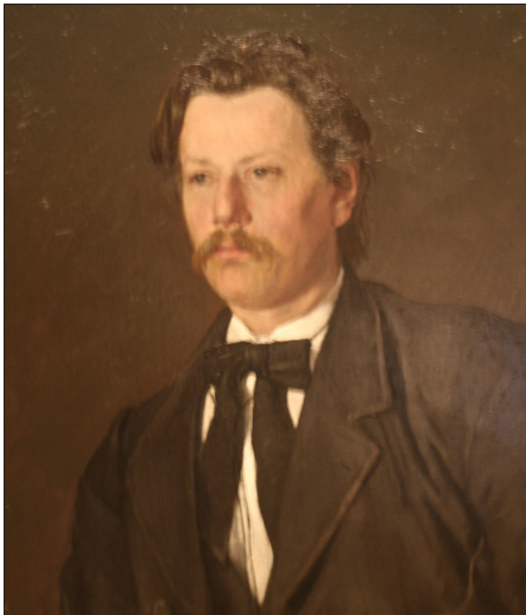
Portræt 1884 af L. A. Ring