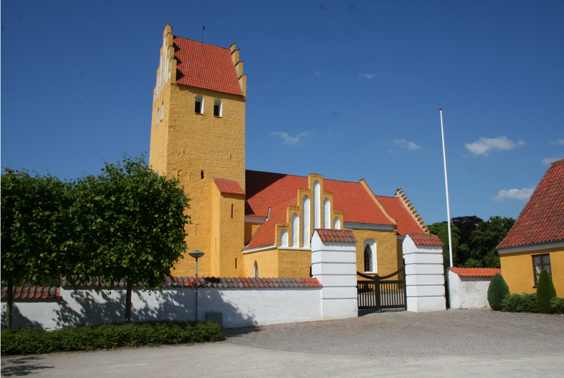
Hammer Kirke 2008.